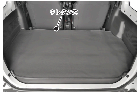
② 本品をラゲージの形状に合わせて敷きます。 ※ウレタン芯が取付けられている方が奥側になります。