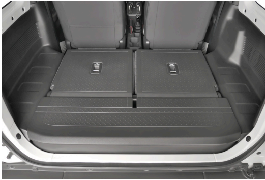
① 後席のマクラを外してから背を倒します。